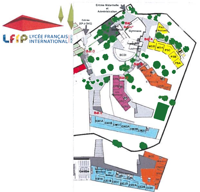
IMPLANTATION PREVISIONNELLE 2018-2019

Le directeur remercie l'ensemble des collègues pour l'ensemble des mouvements qui seront réalisés avant la rentrée.